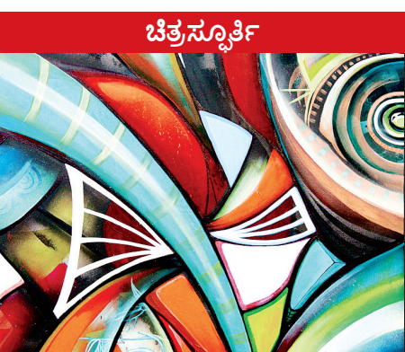
ನಿಮ್ಮ ಬದುಕಿನ ವ್ಯಾಪ್ತಿ ಯನ್ನು ನೀವೇ ಬರೆಯಿರಿ. ಯಾರೋ ನ್ಯಾಯ ಸಿದ್ಧರನ್ನು ಒಪ್ಪಿಕೊಳ್ಳುವುದು ಹೇಗೆ?!

ಮತ್ತೆ ದೇಶದ ವಿಸ್ತಾರಕ್ಕೆ ಬಂದರೆ, ಕೆಲ ರಾಜ್ಯಗಳು ಏರುವುದು ತಾಪಮಾನದಿಂದ ತಪ್ಪಿಸಿಕೊಳ್ಳಲು ಸಾಧ್ಯವಾಗುತ್ತಿಲ್ಲ. ಏಕೆಂದರೆ ಅಲ್ಲಿ ಅತಿಯಾದ ಪರಿಸರದ ಮೇಲಿನ ವ್ಯತಿರಿಕ್ತ ಪರಿಣಾಮ ಹಾಗೂ ಕೈಗಾರಿಕೀಕರಣದಿಂದಾಗಿ ಈ ಪರಿಣಾಮ ಉಂಟಾಗಿದೆ. ಆದರೆ ಜನತೆಯ ಸಂಕಷ್ಟ ತಪ್ಪಿಸಲು ಕೆಲವೊಂದು ತಾತ್ಕಾಲಿಕ ಪರಿಹಾರೋಪಾಯಗಳನ್ನು ಕೂಡಲೇ ಕಂಡುಹಿಡಿಯಬೇಕು. ಇದಕ್ಕೆ ಸ್ಥಳೀಯ ರಾಜ್ಯ ಸರ್ಕಾರ ಮತ್ತು ಕೇಂದ್ರ ಸರ್ಕಾರದ ತೀವ್ರ ಮುಂದಾಗಬೇಕು.