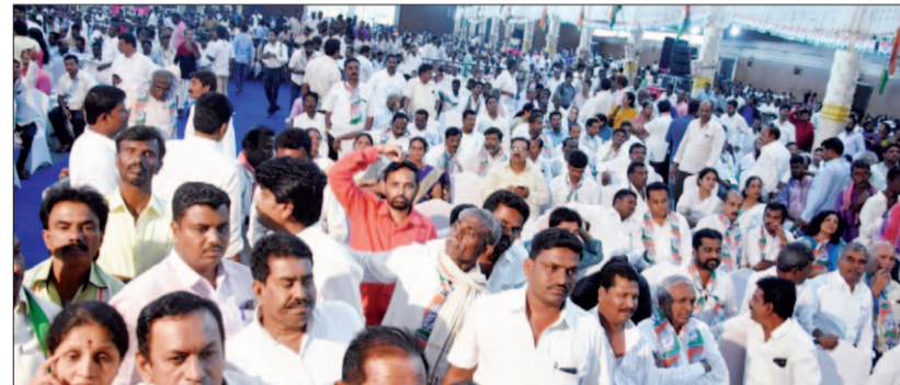
ಸಮಾರಂಭದಲ್ಲಿ ನೆರೆದಿದ್ದ ಕಾಂಗ್ರೆಸ್ ಕಾರ್ಯಕರ್ತರ ದಂಡ.

ಮಾಡಲು ಅಧ್ಯಕ್ಷನಾಗಿಲ್ಲ. ಕಾಂಗ್ರೆಸ್ ಪಕ್ಷ ದೇಶಕ್ಕೆ ತ್ಯಾಗ ಮಾಡಿದ್ದು, ಅಧಿಕಾರಕ್ಕಾಗಿ ಅಲ್ಲ. ಈಗಿನ ಸರ್ಕಾರದಲ್ಲೂ 80 ಸ್ಥಾನ ನಮ್ಮದೇ ಇದ್ದರೂ ಕೆಲವು 38 ಸ್ಥಾನದವರಿಗೆ ಅಧಿಕಾರ ನಡೆಸಲು ಕೋರಲಿರುವುದು ದೇಶದಲ್ಲಿ ಮತೀಯ ಶಕ್ತಿಗಳಿಗೆ ಅಧಿಕಾರ ಸಿಗಬೇಕೆಂದು ಎಂಬ ಒಡ್ಡೆ 'ದಿಂದ. ಇದನ್ನು ಎಲ್ಲರೂ ಅರ್ಥ ಮಾಡಿಕೊಳ್ಳಬೇಕು ಎಂದರು. ಮಾರ್ಗದರ್ಶನ ನೀಡಿದ ರಾಹುಲ್: ಕೆ.ಪಿ.ಸಿ. ಕಾರ್ಯಾಧ್ಯಕ್ಷ ಈಶ್ವರ ಖಂಡ್ರೆ ಮಾತನಾಡಿ, ಪಕ್ಷದ ಅಧ್ಯಕ್ಷರು ನಮ್ಮ ಮೇಲಿಟ್ಟಿರುವ, ನಂಬಿಕೆ ಪ್ರವರ್ಧಕ ಅಭಯವಾಗಿದ್ದೇವೆ. ಕಾಂಗ್ರೆಸ್ 133 ವರ್ಷಗಳ ಇತಿಹಾಸವಿರುವ ಪಕ್ಷವಾಗಿದ್ದು, ಇತ್ತೀಚೆಗೆ ರಾಹುಲ್ ಗಾಂಧಿ ಅವರನ್ನು ಭೇಟಿ ಮಾಡಿ ಮಾರ್ಗದರ್ಶನ ಪಡೆದಿದ್ದೇವೆ. ಅವರ ಸಲಹೆಯಂತೆ ಮುಂದಿನ ಚುನಾವಣೆ ಎದುರಿಸುತ್ತೇವೆ. ವಿಧಾನಸಭಾ ಚುನಾವಣೆಯಲ್ಲಿ ಬನ್ನಬೇಡಿರಿಗಬಹುದು. ನಮ್ಮ ಭಾಗ್ಯ ಯೋಜನೆಗಳು ಜನಮಾನಸದಲ್ಲಿವೆ. ವಿರೋಧಿಗಳ ಪಕ್ಷದಲ್ಲಿರುವ ಸೋಲನುಭವಿಸುವಂತಾಯಿತು. ಲೋಕಸಭಾ ಚುನಾವಣೆಯಲ್ಲಿ ಕಾಂಗ್ರೆಸ್ ಕನಿಷ್ಠ 20 ಸ್ಥಾನ ಗೆಲ್ಲಬೇಕು. ಈ ಮೂಲಕ ರಾಜ್ಯದಲ್ಲಿ ಬಿಜಿಪಿಯನ್ನು ಬುಡುಕಿಸುವ ಕೆಲಸಕ್ಕೆ ಯಶಸ್ವಿ ಎಂದು ಕರೆ ನೀಡಿದರು.