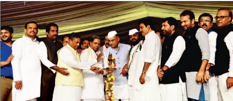
ಕೆ.ಪಿ.ಸಿ. ನೂತನ ಅಧ್ಯಕ್ಷ ದಿನೇಶ್ ಗುಂಡೂರಾವ್ ಮತ್ತು ಕಾರ್ಯಾಧ್ಯಕ್ಷರಾಗಿ ಈಶ್ವರ ಖಂಡ್ರೆ ಪದಗ್ರಹಣ ಮಾಡಿದ ಸಂದರ್ಭದಲ್ಲಿ ನೆರೆದಿದ್ದ ಕಾಂಗ್ರೆಸ್ ಪಕ್ಷದ ಘಟಾನುಘಟಿ ನಾಯಕರು.

ಕಾಂಗ್ರೆಸ್ ಸರ್ಕಾರ ಜನ್ಮಿಸಿ, ಅಭಿವೃದ್ಧಿ ಪಡೆ ಕಾರ್ಯಕ್ರಮಗಳನ್ನು ನೀಡಿದೆ. ಆದರೆ, ಸೂಕ್ತ ಪ್ರಚಾರದ ಕೊರತೆ ಹಾಗೂ ಬಿಜಿಪಿಯವರ