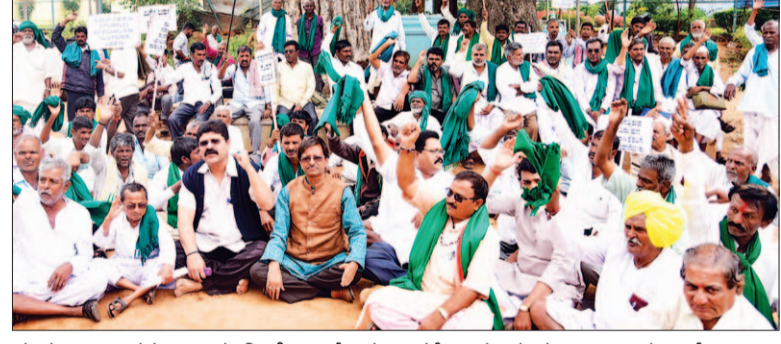
ಮಹದಾಯಿ- ಕಳೆದ ಬುಧವಾರ ಯೋಜನೆ ಅನುಷ್ಠಾನಕ್ಕೆ ಹಾಗೂ ಸಂಪೂರ್ಣ ಸಾಲಮನ್ನಾಕ್ಕೆ ಒತ್ತಾಯಿಸಿ ಮಹದಾಯಿ ಹೋರಾಟಗಾರರು ಬುಧವಾರ ಬೆಂಗಳೂರಿನಲ್ಲಿ ಪ್ರತಿಭಟನೆ ನಡೆಸಿದರು.