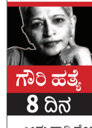
ಗೌರಿ ಹತ್ಯೆ 8 ದಿನ

ವೇದಿಕೆ ಮೇಲೆ ಕೆಲವು ಮಾಜಿ ನಕ್ಕಲರು ಕಾಣಿಸಿಕೊಂಡಿದ್ದು ವಿಶೇಷ. ಭಾಷಣದ ನಂತರ ಒಂದು ಗೀತೆ ಹಾಡುವ ಪರಿಪಾಠ ಸಮಾವೇಶದ ಉದ್ದಕ್ಕೂ ಇತ್ತು. ಎಲ್ಲವೂ ಸಮಾನತೆ ಎಂಬ ಹೆಸರಿನ ಕೆಳಕೆಲಸಂ ಸಾಲುಗಳ ಗೀತೆಗಳಾಗಿದ್ದು ಇನ್ನೊಂದು ಹಿಂದುತ್ವ ಎಂಬುದನ್ನೇ ಗುರುತಿಸಿಕೊಳ್ಳಲಾಗಿತ್ತು. ಇಂಗ್ಲಿಷ್ ಗೀತೆಯೊಂದನ್ನು ಹಾಡಿದ ನಂತರ ವೇದಿಕೆ ಕೆಳಗಿದ್ದ ಹಿಂದುರೊಬ್ಬರು ಈ ಗೀತೆ ಬೇಕಿತ್ತು? ಎಂದು ಮೂರ್ಖಾನೆಯಾಗಿ ಪ್ರಶ್ನೆ ಮಾಡಿದ್ದು ಕಂಡುಬಂತು.