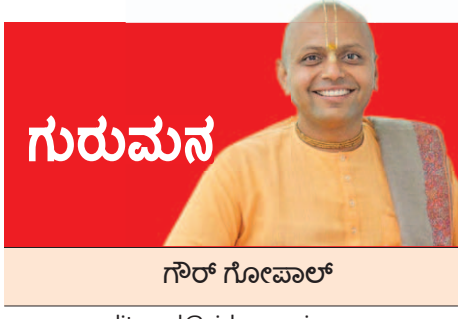
ಗುರುಮನ ಗೌರ್ ಗೋಪಾಲ್

ಒಮ್ಮೆ ಒಬ್ಬ ಶ್ರೀಮಂತ ಮಹಿಳೆ ಸಂತೋಷವನ್ನು ಹುಡುಕಿಕೊಂಡು ಕೌನ್ಸಿಲರ್ ಬಳಿ ಹೋದಳು. ನನಗೆ ಜೀವನದಲ್ಲಿ ಎಲ್ಲವೂ ಇದೆ. ಉಡುಪು ದುಬಾರಿ ಬ್ರಾಂಡ್‌ಡೆಡ್ ಬಟ್ಟೆಗಳಿವೆ, ಓಡಾಡಲು ಕಾರು, ಮನೆಯಲ್ಲಿ ಎಲ್ಲ ಅಲವು ಮೃಗಗಳಿವೆ. ಆದರೂ ನಾನು ಸಂತೋಷವಾಗಿಲ್ಲ.