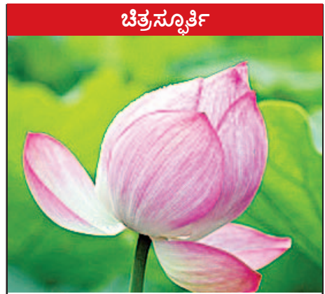
ಪ್ರಪಂಚದ ಮಂದಿರದ ಸಂಗತಿಗಳನ್ನು ಎಳೆಸಿ ಮಾಡುವಾಗ ನಿಮ್ಮನ್ನು ಸೇರಿಸಿಕೊಳ್ಳಲು ಮೆರೆಯಬೇಡಿ!