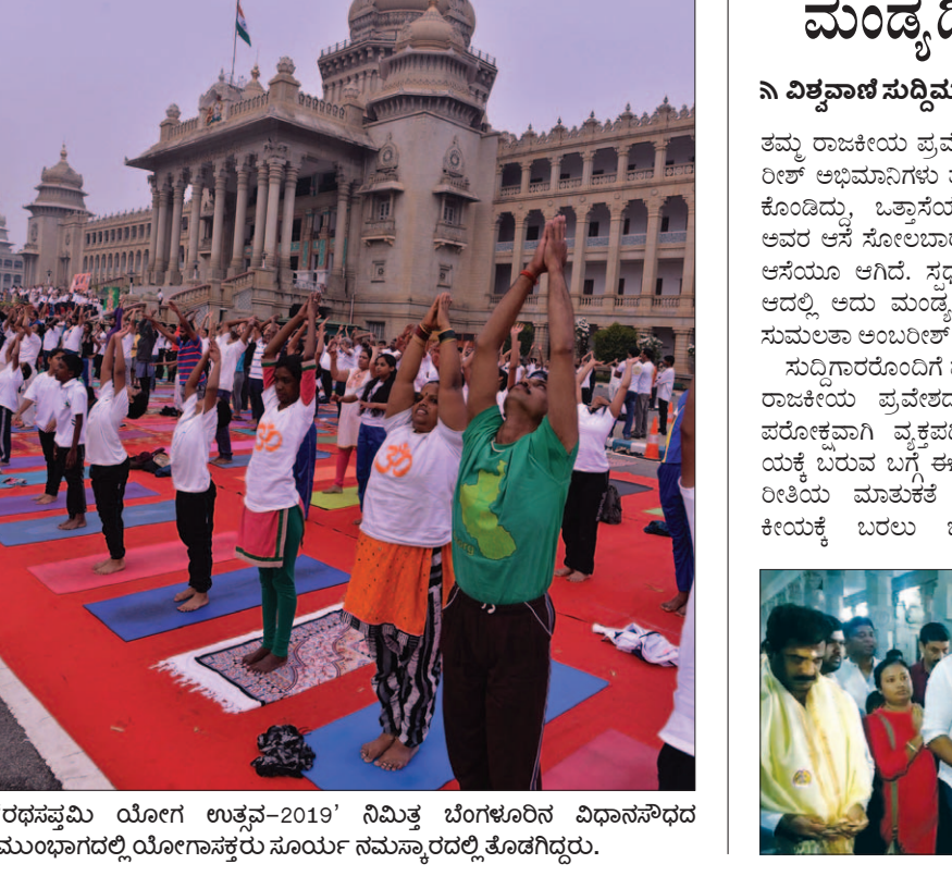
'ಧರ್ಮವಿಮುಕ್ತ ಯೋಗ ಉತ್ಸವ-2019' ನಿಮಿತ್ತ ಬೆಂಗಳೂರಿನ ವಿಧಾನಸೌಧದ ಮುಂಭಾಗದಲ್ಲಿ ಯೋಗಾಸಕ್ತರು ಸೂರ್ಯ ನಮಸ್ಕಾರದಲ್ಲಿ ತೊಡಗಿದ್ದರು.