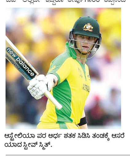
ಆಸ್ಟ್ರೇಲಿಯಾ ಪರ ಅರ್ಧ ಶತಕ ಸಿಡಿಸಿ ತಂಡಕ್ಕೆ ಆಸರೆಯಾದ ಸ್ಟೀವ್ ಸ್ಮಿತ್.