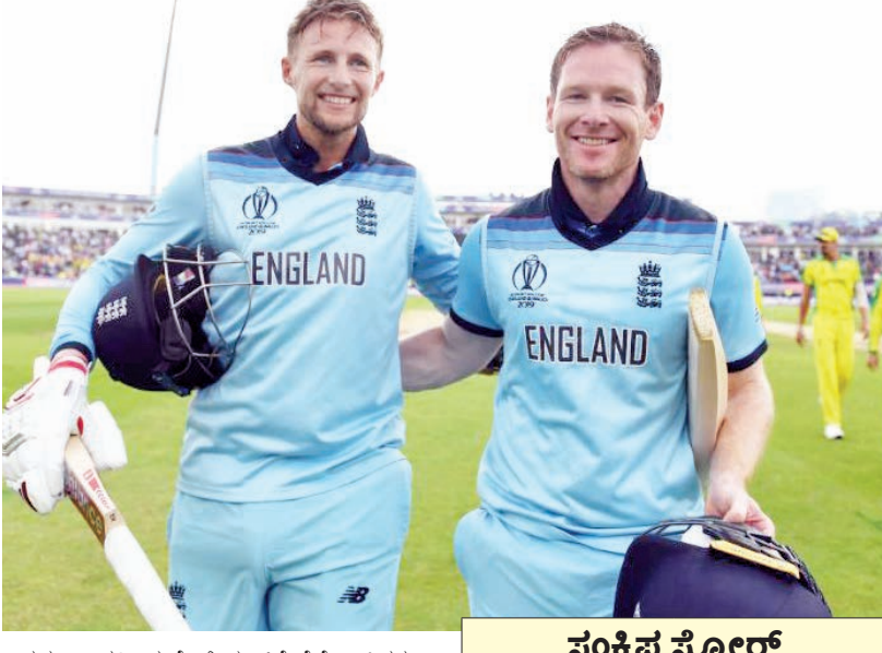
ಅಸಮಾಧಾನದಿಂದ ಪವಿತ್ರಿಯನ್ ಹೆಚ್ಚು ಹಾಕಿದರು. ನಂತರ ಮೂರನೇ ವಿಕೆಟ್ ಗಳ ಜಯದ ನಾಯಕ ಇಯಾನ್ ಮಾರ್ಗನ್ ಹಾಗೂ ಜೋ ರೂಟ್ ಜೋಡಿ 79 ರನ್ ಜತೆಯಾಟವಾದ ಮೂಲಕ ಇಂಗ್ಲೆಂಡ್ ತಂಡವನ್ನು ಇನ್ನೂ 17.5 ಓವರ್ ಬಾಕಿ ಇರುವಂತೆ ದಡ ಸೇರಿಸಿತು. ಅದ್ವಿತೀಯ ಲಯದಲ್ಲಿರುವ ಜೋ ರೂಟ್ 46 ಎಸೆಗಳಲ್ಲಿ 49 ರನ್ ಗಳಿಸಿದರೆ, ಇಯಾನ್ ಮಾರ್ಗನ್ 39 ಎಸೆಗಳಲ್ಲಿ 45 ರನ್ ಗಳಿಸಿ ಅಜೇಯರಾಗಿ ಉಳಿದರು. ಭಾನುವಾರ ನ್ಯೂಜಿಲ್ಯಾಂಡ್ ವಿರುದ್ಧ ಲಾರ್ಡ್ ಕ್ರೀಡಾಂಗಣದಲ್ಲಿ ಫೈನಲ್ ಕಾದಾಟದಲ್ಲಿ ಇಂಗ್ಲೆಂಡ್ ಸೇರಲಿದೆ.

ಬರ್ಮಿಂಗ್ಹ್ಯಾಂ: ಮೂರು ವಿಭಾಗಗಳಲ್ಲಿ ಸಂಘಟಿತ ಪ್ರದರ್ಶನ ತೋರಿದ ಇಂಗ್ಲೆಂಡ್ ಏಷಿಯನ್ ವಿಶ್ವಕಪ್ ಎರಡನೇ ಸೆಮಿಫೈನಲ್ ಪಂದ್ಯದಲ್ಲಿ ಹಾಲಿ ಚಾಂಪಿಯನ್ ಆಸ್ಟ್ರೇಲಿಯಾ ವಿರುದ್ಧ 8 ವಿಕೆಟ್ ಗಳ ಜಯ ಸಾಧಿಸಿತು. ಇದರೊಂದಿಗೆ ವಿಶ್ವಕಪ್ ಇತಿಹಾಸದಲ್ಲಿ ಇಂಗ್ಲೆಂಡ್ ನಾಲ್ಕನೇ ಬಾರಿ ಫೈನಲ್ ತಲುಪಿತು. ಇಲ್ಲಿನ ಎಸ್ಟಾನ್ ಕ್ರೀಡಾಂಗಣದಲ್ಲಿ ಟಾನ್ ಗೆದು ಮೊದಲ ಬ್ಯಾಟಿಂಗ್ ಮಾಡಿದ್ದ ಆಸ್ಟ್ರೇಲಿಯಾ 49 ಓವರ್ ಗಳಿಗೆ ತನ್ನಲ್ಲಿ ವಿಕೆಟ್ ಕಳೆದುಕೊಂಡು 223 ರನ್ ದಾಖಲಿಸಿತ್ತು. ಬಳಿಕ, ಸಾಧಾರಣ ಮೊದಲ ಗುರಿ ಹಿಂಬಾಲಿಸಿದ ಅಂಗ್ಲರು, 32.1 ಓವರ್ ಗಳಲ್ಲಿ ಎರಡು ವಿಕೆಟ್ ಕಳೆದುಕೊಂಡು 226 ರನ್ ಗಳಿಸಿ ಗೆಲುವಿನ ನಗೆ ಬೀರಿತು.