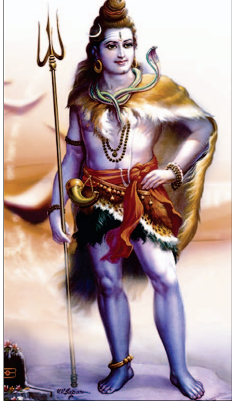
ಪಂಚರಾತ್ರಿಲಿಂಗ, ಪಾಷಾಣಲಿಂಗ ಇಂತಹ ವಿಧವಲಿಂಗಗಳನ್ನು ಶಿವಪೂಜೆಯಲ್ಲಿ ಉಪಯೋಗಿಸುತ್ತಾರೆ.'

● ಶೈವರು, ಕಾಶ್ಮೀರಿಕರು, ಗೋನೀಸು ಗಳು, ವೀರಶೈವ ಇತ್ಯಾದಿ ಸಂಪ್ರದಾಯದವರು ತಮ್ಮ-ತಮ್ಮ ಸಂಪ್ರದಾಯಕ್ಕನುಸಾರ ಪಾರ್ಥಿವಲಿಂಗ, ಕಂಠಶೈಲಿಂಗ (ಕೊಂಠಿನಲ್ಲಿ ಧರಿಸಿರುವ ಬೆಳ್ಳಿಯ ಪಟ್ಟಿಗೆಯಲ್ಲಿನ ಲಿಂಗ), ಸ್ಥಳಿಕಲಿಂಗ, ಬಾಣಲಿಂಗ,