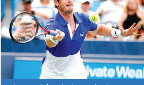
ಯುವ ಓಪನ್ ಸಿಂಗಲ್ಸ್ ಆಡಿದರಲು ನಿರ್ಧಾರ

ವಾಷಿಂಗ್ಟನ್: ಮೂರು ಬಾರಿ ಗ್ರ್ಯಾಂಡ್ ಸ್ಲಾಮ್ ಚಾಂಪಿಯನ್ ಆಂಡಿ ಮರ್ರೆ ಅವರು ಸಿನಿಗಾಟ ಓಪನ್ ಮೊದಲ ಸುತ್ತಿನ ಪಂದ್ಯದಲ್ಲಿ ರಿಚರ್ಡ್ ಗ್ಯಾಸ್ಟೆಟ್ ವಿರುದ್ಧ ಸೋತು ನಿರಾಸೆ ಅನುಭವಿಸಿದರು. ರಿಚರ್ಡ್ ಗ್ಯಾಸ್ಟೆಟ್ ಅವರು ಕಳೆದ ಹೋರಾಟ ನಡೆಸಿ ಮರ್ರೆ ವಿರುದ್ಧ 6-4, 6-4 ಅಂತರದಲ್ಲಿ ಗೆದ್ದು ಎರಡನೇ ಸುತ್ತಿಗೆ ಲಗ್ಗೆ ಇಟ್ಟಿದ್ದಾರೆ. ಸೋಲಿನೊಂದಿಗೆ ಹಲವು ತಿಂಗಳು ಬಳಿಕ ಅಂಗಳಕ್ಕೆ ಮರಳಿದ್ದ ಆಂಡಿ ಮರ್ರೆಗೆ ತೀವ್ರ ನಿರಾಸೆ ಉಂಟಾಯಿತು. ನನಗೆ ಅನಿಸಿದ ಹಾಗೆ ಪಂದ್ಯದಲ್ಲಿ ಆಡಿದ್ದು ಕೃಪಿ ತಂದಿದೆ. ನಾನು ಅಂದುಕೊಂಡಿದ್ದ ರೀತಿಯಲ್ಲಿ ಆಡಿದ್ದೇನೆ ಎಂದು ಪಂದ್ಯದ ಬಳಿಕ ಮರ್ರೆ ಪ್ರತಿಕ್ರಿಯಿಸಿದರು. ಜನವರಿ 14 ರಂದು ನಡೆದಿದ್ದ ಆಸ್ಟ್ರೇಲಿಯಾ ಓಪನ್‌ನಲ್ಲಿ ಕೊನೆಯ ಬಾರಿ ಪುರುಷರ ಸಿಂಗಲ್ಸ್ ಪಂದ್ಯವಾಡಿದ್ದರು. ಐದು ಸೆಟ್‌ಗಳಲ್ಲಿ ಸೋಲು ಅನುಭವಿಸಿದ್ದರು. ಆ ವೇಳೆ ಅವರು ಟೆನಿಸ್ ವೃತ್ತಿ ಜೀವನಕ್ಕೆ ವಿಧಾಯಿ ಹೇಳುವ ಮುನ್ನೂಚನೆ ನೀಡಿದ್ದರು. 32 ರ ಪ್ರಾಯದ ಮರ್ರೆ ಅವರು ಜನವರಿ 28 ರಂದು ಬಲ ಸೊಂಟದ ಮರುಕಳಿಸುವ ಶಸ್ತ್ರಚಿಕಿತ್ಸೆಗೆ ಒಳಗಾಗಿದ್ದು, ಇನ್ನೂ ಚಿಕಿತ್ಸಿಸಿಕೊಳ್ಳುತ್ತಿದ್ದಾರೆ.