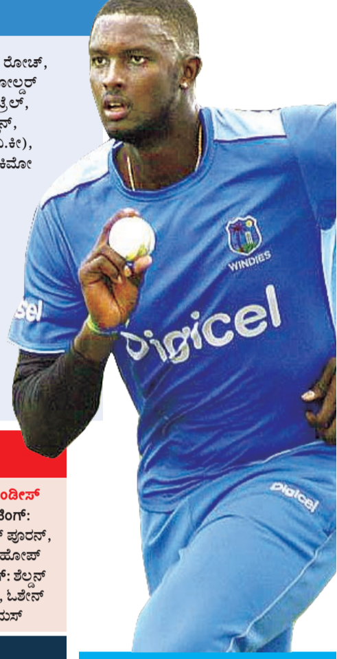
ಸಮಯ: ಇಂದು ಸಂಜೆ 07:00 ಸ್ಥಳ: ಕ್ರೀಡಾ ಪಾರ್ಕ್ ಓವಲ್, ಪೋರ್ಟ್ ಆಫ್ ಸ್ಪೀನ್