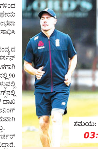
ಸಮಯ: ಮಧ್ಯಾಹ್ನ 03:30

ಲಂಡನ್: ಪ್ರತಿಷ್ಠಿತ ಆಲ್ರೌಂಡರ್ ಸರಣಿಯ ಮೊದಲನೇ ಹಣಕಾಸಿನಲ್ಲಿ ಆಸ್ಟ್ರೇಲಿಯಾ ವಿರುದ್ಧ 251 ರನ್ ಗಳಿಂದ ಭಾರಿ ಅಂತರದಲ್ಲಿ ಸೋಲು ಅನುಭವಿಸಿದ್ದ ಆಸ್ಟ್ರೇಲಿಯಾ ಇಂಗ್ಲೆಂಡ್. ಇಂದು ದಿ ಲಾರ್ಡ್ಸ್ ಅಂಗಳದಲ್ಲಿ ಆರಂಭವಾಗುವ ಎರಡನೇ ಟೆಸ್ಟ್ ಪಂದ್ಯದ ಗೆದ್ದು ಸಮುಖ ಸಾಧಿಸಿಕೊಳ್ಳುವ ತುಡಿತದಲ್ಲಿ ಕೇಂಕ್ಷೆ ಇಳಿಯಲಿದೆ. ಎಸ್ಟಾಬ್ಲಿಷ್ಡ್ ಕ್ರೀಡಾಂಗಣದಲ್ಲಿ ಮೊದಲ ಪಂದ್ಯದ ಆರಂಭಿಕ ದಿನದ ಹಿರಿಯ ವೇಗಿ ಜೇಮ್ಸ್ ರಾಯ್ ಅವರು ಕೇವಲ ನಾಲ್ಕು ಓವರ್ ಎಸೆದು ಗಾಯಕ್ಕೆ ಒಳಗಾಗಿ ಅಂಗಳ ತೊರೆದಿದ್ದರು. ಆದಾಗ್ಯೂ ಪ್ರಥಮ ಇನ್ನಿಂಗ್‌ನಲ್ಲಿ 90 ಮುನ್ನಡೆ ಗಳಿಸಿದ್ದ ಲಾಭ ಸದುರಿಯಾಗಬೇಕೆಂಬಲ್ಲಿ ಅಂಗರ ವಿಫಲರಾಗಿದ್ದರು. ಎರಡನೇ ಇನ್ನಿಂಗ್‌ನಲ್ಲಿ ಪುಟಿದೇಳಿದ ಆಸ್ಟ್ರೇಲಿಯಾ ಏಳು ಏಕೆಟ್ ಸಪ್ಲೆಟ್ 487 ರನ್ ದಾಖಲಿಸಿತ್ತು. ಗುರಿ ಹಿಂಬಾಲಿಸಿದ್ದ ಇಂಗ್ಲೆಂಡ್ ದ್ವಿತೀಯ ಇನ್ನಿಂಗ್‌ನಲ್ಲಿ ಬ್ಯಾಟಿಂಗ್‌ನಲ್ಲಿ ವಿಫಲವಾಗಿತ್ತು. ಅಂತಿಮವಾಗಿ ಆಸ್ಟ್ರೇಲಿಯಾ ಅಂತರದಲ್ಲಿ ಗೆದ್ದು ಪಾರವು ಸಾಧಿಸಿತ್ತು. ಇಂದಿನ ಪಂದ್ಯದಲ್ಲಿ ಯುವ ವೇಗಿ ಜೊಹಾನ್ ಆರ್ಚರ್ ಅವರಿಗೆ ನಾಯಕ ಜೋ ರೋಚ್ ಮೊರೆ ಹೋಗಲಿದ್ದಾರೆ. ಕಳೆದ ಪಂದ್ಯದಲ್ಲಿ ಸ್ವೀಡ್ ಸ್ವೀಟ್ 144 ಮತ್ತು 142 ಎರಡೂ ಇನ್ನಿಂಗ್‌ಗಳಲ್ಲಿ ಶತಕ ಸಿಡಿಸಿದ್ದರು. ಇವರನ್ನು ಕಟ್ಟಿ ಹಾಕಲು ಆರ್ಚರ್‌ಗೆ ಜವಾಬ್ದಾರಿ ನೀಡಬಹುದು.