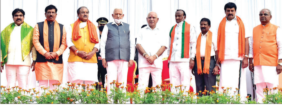
ನೂತನ ಸಚಿವರೊಂದಿಗೆ ರಾಜ್ಯಪಾಲ ವಿ.ಆರ್.ವಾಲಾ ಮತ್ತು ಮುಖ್ಯಮಂತ್ರಿ ಯಡಿಯೂರಪ್ಪ.

ರಾತ್ರಿಯೇ ಕಾಡಿದ ಕ್ರಮ: ಮಂಗಳವಾರ ಸಂಜೆಯೇ ಮುನಿರತ್ನ ಅವರ ಹೆಸರು ಸಂಪುಟದ ಪಟ್ಟಿಯಿಂದ ಬಿಟ್ಟು ಹೋಗಿರುವ ಬಗ್ಗೆ ಮುನಿರತ್ನ ಅವರಿಗೆ ಮಾಹಿತಿ ಲಭಿಸಿದೆ. ಕೂಡಲೇ ಯಡಿಯೂರಪ್ಪ ಅವರ ನಿವಾಸಕ್ಕೆ ದೌಡಾಯಿಸಿದ ಮುನಿರತ್ನ ಅವರು, ಇಡೀ ರಾತ್ರಿ ಸಂಪುಟದ ಪಟ್ಟಿಯಲ್ಲಿ ತಮ್ಮ ಹೆಸರನ್ನು ಸೇರಿಸಲು ಹೋರಾಡಿದ್ದಾರೆ. ಆದರೆ ಮುಖ್ಯಮಂತ್ರಿ ಯಡಿಯೂರಪ್ಪ ಅವರು 'ಎಲ್ಲವೂ ವರಿಷ್ಠ ತೀರ್ಮಾನ'ವೆಂದು ಹಿಂದೆ ಸರಿದರು. ಈ ವೇಳೆ ಅರುಣ್ ಸಿಂಗ್ ಅವರ ಬಳಿ ಈ ಬಗ್ಗೆ ಮನವಿ ಮಾಡಲಾಯಿತು. ಆದರೆ 'ಮುಂದಿನ ದಿನಗಳಲ್ಲಿ ಈ ಬಗ್ಗೆ ತೀರ್ಮಾನಿಸೋಣ' ಎನ್ನುವ ಮೂಲಕ ಮುನಿರತ್ನ ಅವರಿಗೆ ನಿರಾಸೆ ಉಂಟು ಮಾಡಿದ್ದಾರೆ ಎನ್ನಲಾಗಿದೆ.