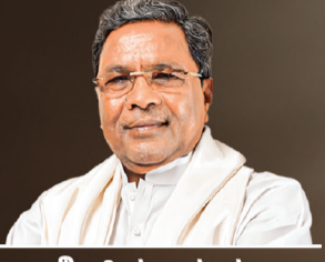
ಶ್ರೀ ಸಿದ್ದರಾಮಯ್ಯ ಮಾನ್ಯ ಮುಖ್ಯಮಂತ್ರಿಗಳು