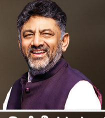
ಶ್ರೀ ಡಿ. ಕೆ. ಶಿವಕುಮಾರ್ ಮಾನ್ಯ ಉಪ ಮುಖ್ಯಮಂತ್ರಿಗಳು

ಗ್ರಾಮೀಣಾಭಿವೃದ್ಧಿ ಮತ್ತು ಪಂಚಾಯತ್ ರಾಜ್ ಇಲಾಖೆ