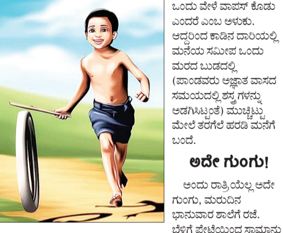
ಅದೇ ಗುರು! ಅಂದು ರಾತ್ರಿಯಲ್ಲಿ ಅದೇ ಗುರು, ಮರುದಿನ ಧಾನುವಾರ ಕಾಲಿಗೆ ರಜೆ. ಬೆಳಿಗ್ಗೆ ಪೇಟೆಯಿಂದ ಸಾಮಾನು ತರಲು ಕಳಿಸಿದಾಗ ಹುಮ್ಮಸ್ಸಿನಿಂದ ಸಾಮಾನಿನ ಪಟ್ಟಿ ಕೈಚೀಲೊಂದಿಗೆ ಹೊರಟೆ. ಒಂದಿನ ದಿನ ಅಡಿಗಿಟ್ಟಿಲ್ಲದ ಚಕ್ರ ತೆಗೆದು ಬಾರು ರಸ್ತೆಯಲ್ಲಿ ಓಡಿಸಿ ಮತ್ತೆ ಅಲ್ಲೇ ಮುಟ್ಟಿ ಇಟ್ಟು ಬರುವ ಯೋಚನೆ ನನ್ನದಾಗಿತ್ತು. ಚಕ್ರವು ಮರದ ಬುಡದಲ್ಲೇ ಸುರಕ್ಷಿತವಾಗಿತ್ತು. ಕಾಡಿನ ಕಾಲುಡಾರಿಯಲ್ಲಿ ಉರುಳಿಸುವುದು ಕಷ್ಟವೆನಿಸಿದರೂ ಹೋಗೇ ತಂದು ಕಾಡಿನಿಂದ ಬಾರು ರಸ್ತೆಗಿಳಿಸಿ ಏರುದಾರಿಯಲ್ಲಿ ಬಹಳ ಉತ್ಸಾಹದಿಂದ ಅಂಕುಡೊಂಕಾದ ರಸ್ತೆಯ ಮೇಲೆ ಸುಮಾರು ಒಂದೆರಡು ಫಲಾಂಗು ಓಡಿಸಿಬಿಡುವುದು.