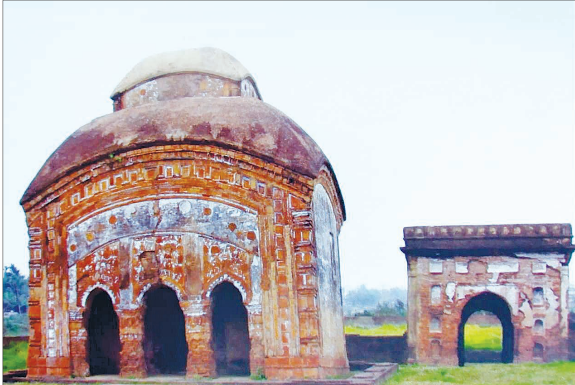
ಘನಶ್ಯಾಮಲಾ ಹಾಸಿ: ಅಸ್ಸಾಂ ರಾಜ್ಯದ ಜೋರ್ಹಟ್‌ನಲ್ಲಿರುವ ಈ ಘನಶ್ಯಾಮಲಾ ಹಾಸಿನ್ನು 17ನೇ ಶತಮಾನದಲ್ಲಿ ರಾಜ ರುದ್ರ ಸಿಂಗರು ಕಟ್ಟಿಸಿದ್ದರು.