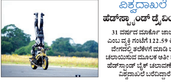
ವಿಶ್ವದಾಖಲೆ ಹೆಡ್‌ಸ್ಟಾಂಡ್ ಡೈವಿಂಗ್ 31 ವರ್ಷದ ಮಾರ್ಕೊ ಚಾರ್ಲೋ ಎಂಬ ವ್ಯಕ್ತಿ ಗಿಂಟೆಗೆ 122.59 ಕಿ.ಮೀ ವೇಗದಲ್ಲಿ ತಲೆಕೆಳಗೆ ಮಾಡಿ ಡೈವ್ ಚಲಾಯಿಸುವ ಮೂಲಕ ಅತಿ ವೇಗದ ಹೆಡ್‌ಸ್ಟಾಂಡ್ ಡೈವ್ ಚಲಾವಣೆಯಲ್ಲಿ ವಿಶ್ವದಾಖಲೆ ಬರೆದಿದ್ದಾರೆ.