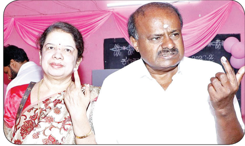
ಮಾಜಿ ಸಿಎಂ ಎಚ್.ಡಿ.ಕುಮಾರಸ್ವಾಮಿ ಹಾಗೂ ಅನಿತಾ ಕುಮಾರಸ್ವಾಮಿ ಮತದಾನ ಚಲಾಯಿಸಿದರು.