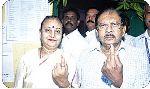
ಗೃಹ ಸಚಿವ ಡಾ.ಬಿ.ಪರಮೇಶ್ವರ್ ಅವರು ದಂಪತಿ ಸಮೇತರಾಗಿ ಮತ ಚಲಾಯಿಸಿದರು.