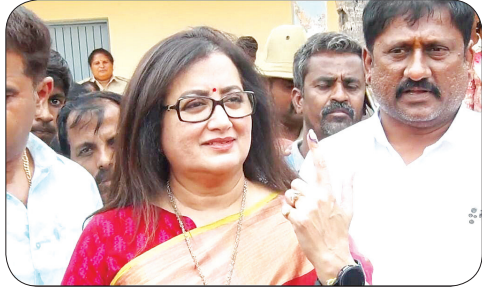
ಸಂಸದ ಸುಲತಾ ಅವರು ಮಂಡ್ಯದಲ್ಲಿ ತಮ್ಮ ಬೆಂಬಲಿಗರೊಂದಿಗೆ ಮತಗಟ್ಟೆಗೆ ಬಂದು ಹಕ್ಕು ಚಲಾಯಿಸಿದರು.