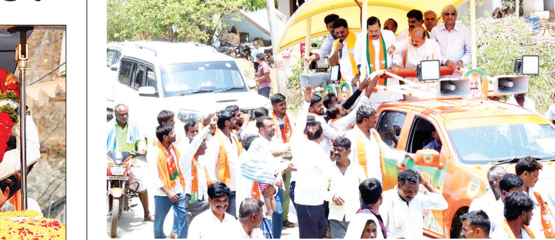
ಹಾನಿಗಲ್ ವಿಧಾನಸಭಾ ಕ್ಷೇತ್ರದ ಮೂರನೇ ಬಿಜೆಪಿ ಕಣದಲ್ಲಿ, ಕಂಚಿನೆಗಳೂರು, ಮಲಗುಂದ ಗ್ರಾಮಗಳಲ್ಲಿ ಹಾವೇರಿ ಗದಗ ಲೋಕಸಭಾ ಕ್ಷೇತ್ರದ ಬಿಜೆಪಿ ಅಭ್ಯರ್ಥಿ ಬಸವರಾಜ ಬೊಮ್ಮಾಯಿ ಚುನಾವಣಾ ಪ್ರಚಾರ ನಡೆಸಿದರು.

ಹಾವೇರಿ: ಚುನಾವಣಾ ರಾಜಕಾರಣಕ್ಕಾಗಿ ಮುಖ್ಯಮಂತ್ರಿ ಸಿದ್ದರಾಮಯ್ಯ ಅವರು ಹಿಂದುಳಿದ ವರ್ಗಗಳ ಆಯೋಗದ ವರದಿ ಪಡೆದು ಒಟ್ಟುಕೊಂಡಿದ್ದಾರೆ. ರಾಜ್ಯ ಸರ್ಕಾರ ಬಳಿ ಇರುವ ವರದಿಯನ್ನೇ ಬಿಡುಗಡೆ ಮಾಡಿಸಲಾಗದ ರಾಹುಲ್ ಗಾಂಧಿ, ದೇಶಾದ್ಯಂತ ಹಿಂದುಳಿದ ವರ್ಗಗಳ ಸಮೀಕ್ಷೆ ಮಾಡುವುದಾಗಿ ಜನರಿಗೆ ಸುಳ್ಳು ಹೇಳುತ್ತಿದ್ದಾರೆ ಎಂದು ಹಾವೇರಿ ಗದಗ ಲೋಕಸಭಾ ಕ್ಷೇತ್ರದ ಬಿಜೆಪಿ ಅಭ್ಯರ್ಥಿ ಬಸವರಾಜ ಬೊಮ್ಮಾಯಿ ಆರೋಪಿಸಿದ್ದಾರೆ.