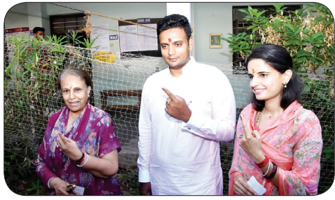
ಮೈಸೂರು-ಕೊಡಗು ಬಿಜೆಪಿ ಅಭ್ಯರ್ಥಿ ಯದುವೀರ ಅವರು ಕುಟುಂಬ ಸಮೇತರಾಗಿ ಮತ ಚಲಾಯಿಸಿದರು.