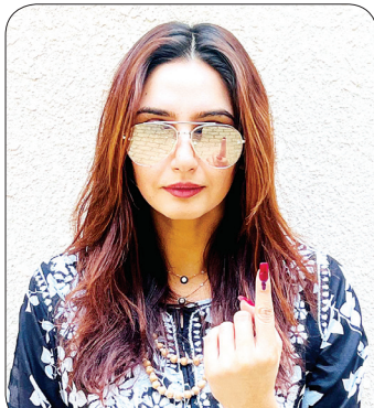
ನಟಿ ರಾಗಿಣಿ ದ್ವಿವೇದಿ ಅವರು ತಮ್ಮ ಹಕ್ಕು ಚಲಾಯಿಸಿದರು.