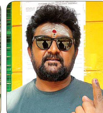
ನಟ ಕೋಮಲ್ ಅವರು ಮತ ಚಲಾಯಿಸಿದರು.