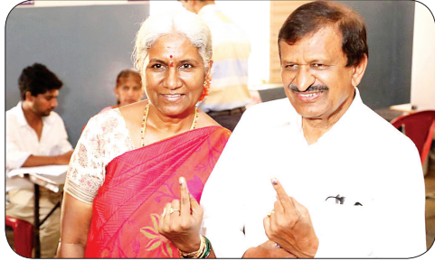
ಬೆಂಗಳೂರು ಗ್ರಾಮಾಂತರ ಬಿಜೆಪಿ ಅಭ್ಯರ್ಥಿ ಡಾ.ಸಿ.ಎನ್ ಮಂಜುನಾಥ್ ದಂಪತಿ ಮತದಾನ ಮಾಡಿದರು.