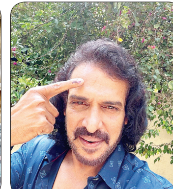
ನಟ ಉಪೇಂದ್ರ ಅವರು ಮತ ಚಲಾಯಿಸಿದರು.