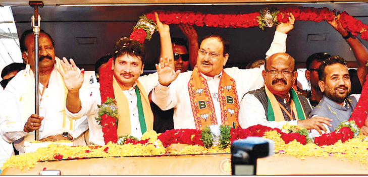
ಕಲಬುರಗಿಯಲ್ಲಿ ಡಾ. ಉಮೇಶ್ ಜಾಧವ ಪರ ಬಿಜೆಪಿ ರಾಷ್ಟ್ರೀಯ ಅಧ್ಯಕ್ಷ ಜೆಪಿ ನಡ್ಡಾ ರೋಡ್ ಶೋ ನಡೆಸಿದರು.

ಕಲಬುರಗಿ: ಕಾಂಗ್ರೆಸ್ ನೇತೃತ್ವದಲ್ಲಿ ರಚನೆಗೊಂಡಿರುವ ಇಂಡಿ ಮೈತ್ರಿಕೂಟದಲ್ಲಿ ಎಲ್ಲಾ ಪಕ್ಷಗಳು ಭ್ರಷ್ಟಾಚಾರದಿಂದ ತುಂಬಿರುವ ಪಕ್ಷಗಳಾಗಿವೆ ಎಂದು ಬಿಜೆಪಿ ರಾಷ್ಟ್ರೀಯ ಅಧ್ಯಕ್ಷ ಜೆಪಿ ನಡ್ಡಾ ಹೇಳಿದರು. ನಗರದ ಸೂಪರ್ ಮಾರ್ಕೆಟ್, ನಲ್ಲಿ ಆದ್ದೂರಿ ರೋಡ್ ಶೋ ಲೋಕಾರ್ಪಣೆ ಕಾರ್ಯಕ್ರಮವನ್ನು ಉದ್ಘಾಟಿಸಿ ಮಾತನಾಡಿದ ಅವರು, ಇಂಡಿಯಾ ಒಕ್ಕೂಟ ಅದೊಂದು ಫುಮಂಟಿ ಒಕ್ಕೂಟವಾಗಿದೆ. ಮೈತ್ರಿಕೂಟದೊಳಗಿನ ಎಲ್ಲಾ ಪಕ್ಷಗಳ ನಾಯಕರು ಒಂದಿಲ್ಲೊಂದು ಭ್ರಷ್ಟಾಚಾರ ಮಾಡಿ ಜೈಲಿಗೆ ಹೋಗಿ ಬಂದವರಾಗಿದ್ದಾರೆ ಲೇವಡಿ ಮಾಡಿದರು. ಕಳೆದ ಹತ್ತು ವರ್ಷಗಳ ಅಡಳಿತದ ಅವಧಿಯಲ್ಲಿ ನಾವು ದೇಶದಲ್ಲಿನ ಭ್ರಷ್ಟಾಚಾರ ನಿರ್ಮೂಲನೆ ಮಾಡುತ್ತಿದ್ದರೆ, ಇವರು ಭ್ರಷ್ಟಾಚಾರವನ್ನು ಎಸಗುತ್ತಿದ್ದಾರೆ. ಭ್ರಷ್ಟಾಚಾರದ ತಪಸ್ಸಿಗೆ ಆದೇಶ ಮಾಡಿದರೆ, ಅದನ್ನು ವಿರೋಧಿಸಲು ಪ್ರಯತ್ನ ಮಾಡುತ್ತಿದ್ದಾರೆ. ಕಾಂಗ್ರೆಸ್, ಸಕೆದ 50 ವರ್ಷಗಳ ಅಡಳಿತದ ಅವಧಿಯಲ್ಲಿ ಕೆಲವರು ಹಗಲೂ, 2ಬೆ ಹಗಲೂ, ಕಾಮನ್‌ವೆಲ್ತ್ ಹಗಲೂ, ಪಲಿಕಾಪ್ಪರ ಹಗಲೂ ಸೇರಿದಂತೆ ಹಲವು ಹಗಲೂ ಮಾಡಿ, ಕಾಂಗ್ರೆಸ್ ಹಲವು ನಾಯಕರು ಇಂದು ಬೇಲ್ ಮೇಲೆ ತಿರುಗಾಟ ನಡೆಸಿದ್ದಾರೆ ಎಂದು ವಾಗ್ದಾಳಿ ನಡೆಸಿದರು. ಬೃಹತ್ ರೋಡ್ ಶೋ: ಇದಕ್ಕೂ ಮುನ್ನ ನಗರದ ಸರ್ಕಾರ ಬಜಾರ್, ನ ಗಣೇಶ ಮಂದಿರದಿಂದ ಆದ್ದೂರಿ ರೋಡ್ ಶೋ ನಡೆಸಿ, ಸರ್ಕಾರ ಬಜಾರ್, ಜಾಂಡೆ ಬಜಾರ್, ಸೂಪರ್ ಮಾರ್ಕೆಟ್ ನ ಪ್ರಮುಖ ಬೀದಿಗಳಲ್ಲಿ ಸಾಗಿ ಬಿಜೆಪಿ ಅಭ್ಯರ್ಥಿ ಡಾ.ಉಮೇಶ್ ಜಾಧವ್ ಅವರ ಪರವಾಗಿ ಮತದಾನ ಚಲಾಯಿಸಿದರು.