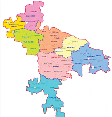
ನ ಅಭಿವೇಶ ಪಾಟೀಲ ಬಾಗಲಕೋಟೆ