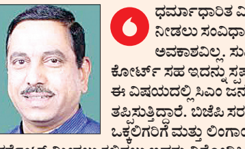
ಪರ್ಲಿಂಗ್ ಮೀಸಲು ಕಲ್ಪಿಸಲು ಇವರು ವಿರೋಧಿಸಿದ್ದರು.