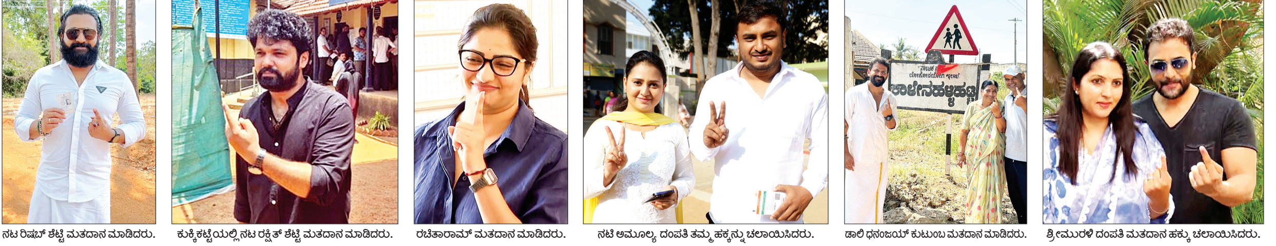
ನಟ ರಿಷಬ್ ಶೆಟ್ಟಿ ಮತದಾನ ಮಾಡಿದರು. ಕುಕ್ಕಿ ಕಟ್ಟಿಯಲ್ಲಿ ನಟ ರಿಷಬ್ ಶೆಟ್ಟಿ ಮತದಾನ ಮಾಡಿದರು. ರಚಿತಾರಾಮ್ ಮತದಾನ ಮಾಡಿದರು. ನಟಿ ಅಮೂಲ್ಯ ದಂಪತಿ ತಮ್ಮ ಹಕ್ಕನ್ನು ಚಲಾಯಿಸಿದರು. ಡಾಲ್ ಧನಂಜಯ್ ಕುಟುಂಬ ಮತದಾನ ಮಾಡಿದರು. ತ್ರೀಮುರಳಿ ದಂಪತಿ ಮತದಾನ ಹಕ್ಕು ಚಲಾಯಿಸಿದರು.