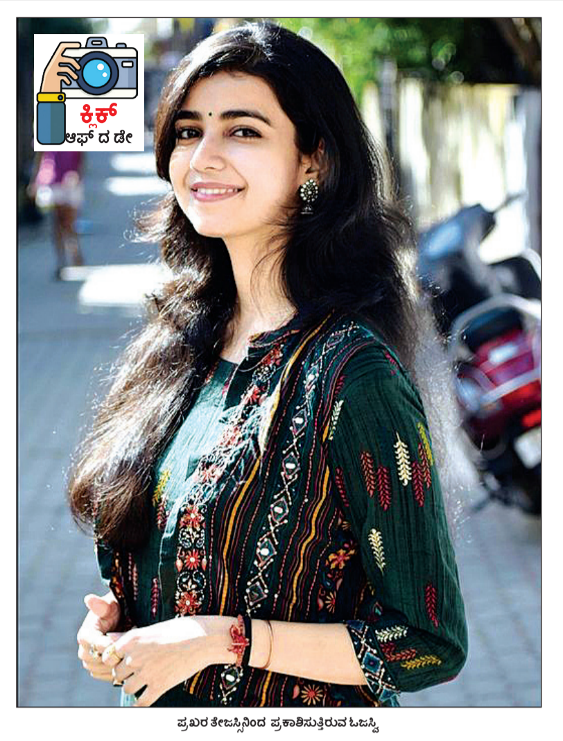
ಪ್ರಖರ ಕೆಜ್ಜಿಸ್ಸಿಂದ ಪ್ರಕಾಶಿಸುತ್ತಿರುವ ಓಜಿಸ್ಸಿ